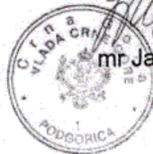
mr Jakov Milatović

PREDSJEDNIK KOMISIJE Ministar ekonomskog razvoja