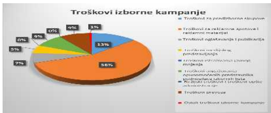
Grafik: Prikaz utrošenih sredstava za izbornu kampanju, u skladu sa dostavljenim izvještajem

Kod kategorije " ostali troškovi izborne kampanje " troškovi su prikazani jedino od strane Socijaldemokrata u iznosu od 775,05€ u šta su uključeni troškovi bankarske provizije, nabavke opreme za krećenje, zakup prostorija, plaćanje poreza i prireza na porez i dr.