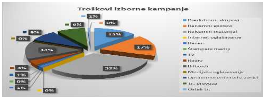
Grafik: Procentualni prikaz utrošenih sredstava za izbornu kampanju

ukupno 9.140€, za prevoz 9.300€, za ostale troškove ukupno 775,05€ i za režijske troškove 119€ (ANEX 1 tabela IV). Procentualni prikaz utrošenih sredstava za izbornu kampanju se može vidjeti u narednom grafičkom prikazu.